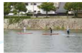
SUP (スタンドアップパドル)